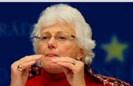
Mariann Fisher Boel Comisaria de Agricultura y Desarrollo Rural

El objetivo de esta iniciativa es ofrecer a los jóvenes talentos en diseño la posibilidad de crear el logo ecológico de la UE, un logo que será impreso millones de veces ya que su uso será obligatorio para todos los productos ecológicos preenvasados que se fabriquen en los 27 Estados Miembros y que cumplan con las normas de etiquetado. Además, todos los productos ecológicos que no estén preenvasados y que se fabriquen en la UE o hayan sido importados de terceros países podrán utilizar este logotipo de forma voluntaria. Podrán participar en este concurso todos los ciudadanos de la UE, matriculados en una institución de educación superior de artes o diseño, situada dentro de la Unión. Se elegirán tres trabajos entre todos los presentados. El ganador recibirá un premio en metálico de 6.000 euros. El primer y segundo finalistas obtendrán premios por valor de 3.500 euros y 2.500 euros, respectivamente. Los diseños se podrán presentar a concurso a través de la web www.ec.europa.eu/organic-logo hasta el 25 de junio de 2009.