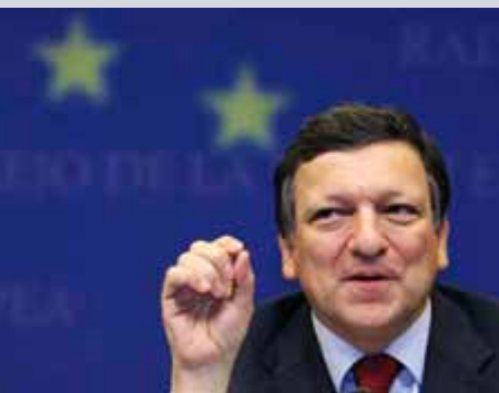
José Manuel Barroso Presidente de la Comisión

http://europa.eu/rapid/pressReleasesAction.do?reference=IP/09/628&format=HTML&aged=0&language=ES&guiLanguage=fr