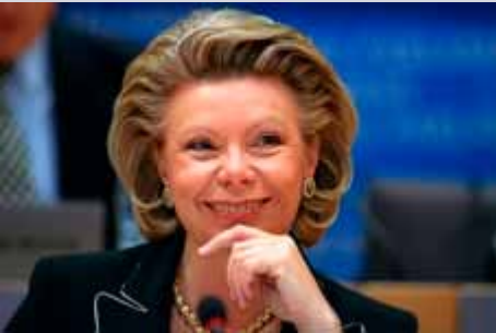
Viviane Reding Comisaria de Sociedad de la Información y Medios de Comunicación

La Comisión dará ejemplo al aumentar en un 70 % para 2013 la financiación actual de 100 millones de euros al año. Viviane Reding, Comisaria de Sociedad de la Información y Medios de Comunicación, ha declarado lo siguiente al inaugurar en Praga la primera «Conferencia europea de futuras tecnologías», «Europa debe ser inventiva y valiente, especialmente en tiempos de crisis. La investigación está en el origen de la innovación, la cual es clave para la competitividad mundial de Europa a largo plazo. Los adelantos científicos y revolucionarios constituyen enormes oportunidades y debemos reunir a los mejores cerebros para sacarles el máximo partido. Combinar los esfuerzos de los 27 Estados miembros de la UE e intensificar la cooperación con los socios del mundo son esenciales para que Europa tome la iniciativa en relación con las futuras tecnologías de la información, que pueden facilitar soluciones radicalmente nuevas para los ciudadanos europeos en ámbitos tales como la salud, el cambio climático, el envejecimiento de la población, el desarrollo sostenible o la seguridad».