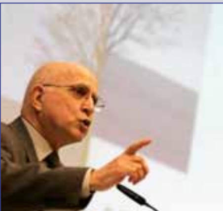
Stavros Dimas Comisario Europeo de Medio Ambiente

http://europa.eu/rapid/pressReleasesAction.do?reference=IP/09/519&format=HTML&aged=0&language=ES&guiLanguage=fr