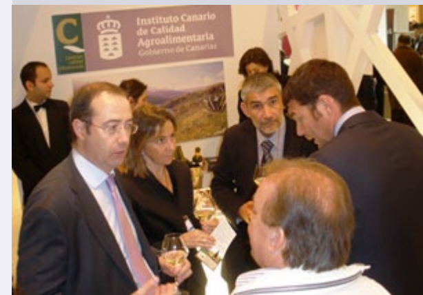
Salón Internacional del Clu Gourmet