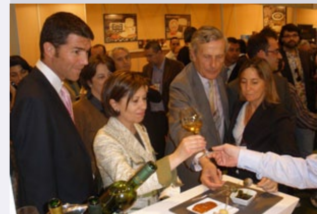
Salón Internacional del Clu Gourmet