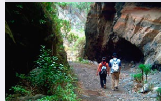
Barranco de Badajoz en Güímar