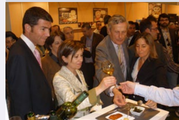
Salón Internacional del Clu Gourmet