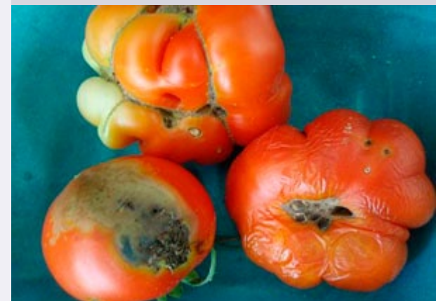
tuta absoluta en el tomate

http://www.gobiernodecanarias.org/noticias/index.jsp?module=1&page=nota.htm&id=125954