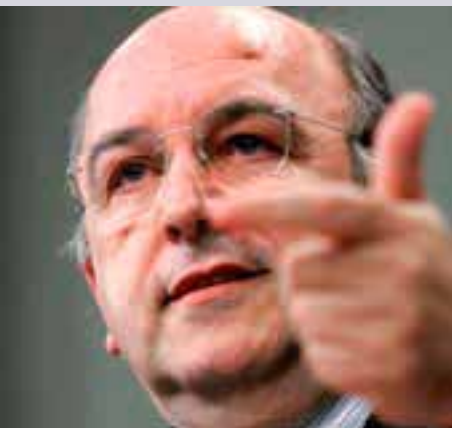
Joaquín Almunia Comisario de Asuntos Económico y Monetarios

http://europa.eu/rapid/pressReleasesAction.do?reference=IP/09/693&format=HTML&aged=0&language=ES&guiLanguage=fr