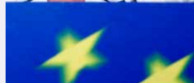
Viviane Reding Comisaria Europea de Sociedad de la Información y Medios de Comunicación