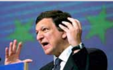
José Manuel Barroso Presidente de la Comisión Europea

Vladimír Špidla, Comisario de Empleo de la UE, ha manifestado: «Nuestra primera prioridad en esta crisis son las personas: el mantenimiento de sus puestos de trabajo y la vuelta al empleo cuanto antes de aquellos que lo han perdido. Debemos utilizar todas las herramientas a nuestro alcance para limitar el impacto de la crisis sobre la economía real, especialmente sobre las personas y sus medios de subsistencia».