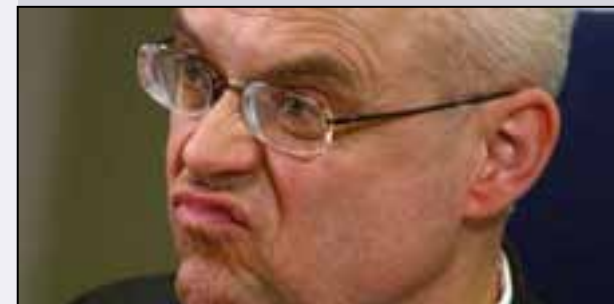
Vladimír Špidla Comisario Europeo de Empleo, Asuntos Sociales, e Igualdad de Oportunidades

«Esperamos que estas medidas tengan unos importantes efectos indirectos para la economía, en particular en el sector de la construcción.» El Comisario Špidla añadió lo siguiente: «A nivel europeo, nuestra principal prioridad en esta crisis son las personas, conseguir que no pierdan sus puestos de trabajo y lograr que los que los han perdido vuelvan a trabajar lo más rápidamente posible. El Fondo Social Europeo está ayudando a miles de europeos a adquirir cualificaciones y a mantener y mejorar su oportunidades laborales. Este acuerdo significa que el Fondo todavía puede hacer una mayor contribución a fin de ayudar a las personas que han perdido su empleo o que están en peligro de perderlo debido a la crisis, y también permitirá que las pequeñas organizaciones presten un mejor apoyo de una manera más fácil».