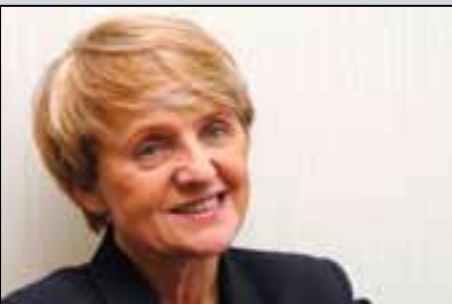
Danuta Hübner Comisaria Europea de Política Regional

Los Comisarios Danuta Hübner ( Política Regional ) y Vladimír Špidla ( Empleo, Asuntos Sociales e Igualdad de Oportunidades ) han dado el 5 de mayo de 2009, la bienvenida a la conclusión de un acuerdo entre el Consejo y el Parlamento Europeo en favor del paquete de la Política de Cohesión en respuesta a la crisis económica. El paquete global incluye una serie de medidas, desde una inyección masiva de liquidez en forma de pago de anticipos adicionales por parte de los Fondos Estructurales hasta procedimientos rápidos a fin de acelerar la aplicación de proyectos y la posibilidad de que la UE cofinancie mejoras de eficiencia energética en la vivienda.