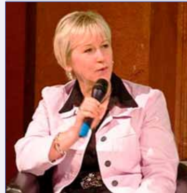
Margot Wallström Vicepresidenta de la Comisión Europea Relaciones Interinstitucionales y Estrategia de Comunicación.

Están en las tarjetas de identificación que utilizamos para entrar a nuestra oficina y en las que utilizamos para pagar el peaje en las autopistas. La Comisión Europea ha adoptado el 12 de mayo de 2009, una serie de recomendaciones destinadas a garantizar que todos los que participan en el diseño o la puesta en funcionamiento de tecnologías que utilizan microprocesadores inteligentes respetan el derecho fundamental de las personas a la intimidad y la protección de datos, contenido en la Carta de los Derechos Fundamentales de la Unión Europea proclamada el 14 de diciembre de 2007.