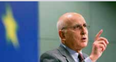
Stavros Dimas Comisario Europeo del Medio Ambiente