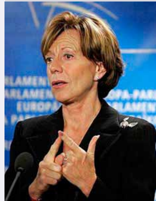
Neelie Kroes Comisaria Europea de Competencia

La Comisión Europea ha presentado el 12 de junio de 2009, un proyecto legislativo para alcanzar un nivel más elevado de protección de la salud y del medio ambiente. El objetivo de la propuesta consiste en mejorar de forma significativa la seguridad de los biocidas utilizados y comercializados en la Unión Europea. Lo que se propone es retirar las sustancias más peligrosas, sobre todo las que pueden provocar cáncer, e introducir nuevas normas respecto a artículos como los muebles y tejidos tratados con biocidas, que no están incluidos en el ámbito de la legislación vigente. La propuesta simplifica la legislación, aportando a la vez nuevos incentivos para que las empresas desarrollen productos más seguros contra animales y microorganismos nocivos.