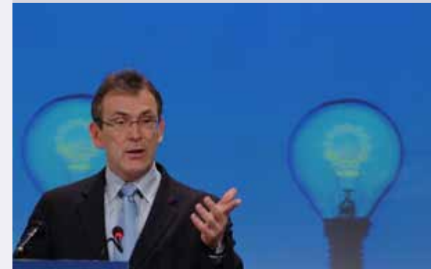
Andris Piegalbs Comisario de Energía