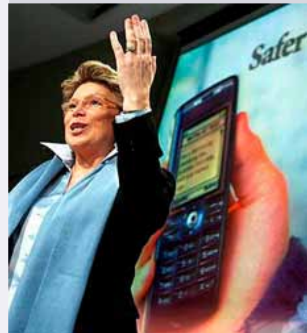
Viviane Reding Comisaria Europea de Sociedad de la Información

Según Viviane Reding, Comisaria europea de Sociedad de la Información y Medios de Comunicación, «invertir en las últimas tecnologías de la información es la mejor manera de contribuir a la cooperación entre las administraciones públicas y de facilitar a las empresas el acceso al mercado de otros Estados miembros. El hecho de prestar servicios en línea sin necesidad de trámites burocráticos permitirá a las empresas europeas abrirse a nuevos mercados e impulsar así el comercio en la UE. Los resultados que se obtengan contribuirán a expandir el crecimiento y el empleo en el mercado único ».