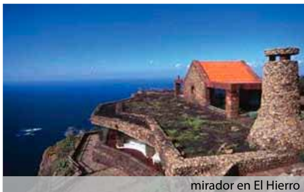
mirador en El Hierro

El Programa de Desarrollo Rural de Canarias (PDR) ¿que se enmarca en el Fondo Europeo Agrícola de Desarrollo Rural (FEADER) creado para contribuir al desarrollo de las zonas rurales de los estados miembros- destinará 335 millones de euros hasta 2013 para el mantenimiento de la actividad económica del sector primario y al desarrollo sostenible de estos núcleos en las islas, de los cuales se ha ejecutado ya 118.692.006,49 euros desde el inicio del plan en 2007 hasta mediados de 2011 correspondientes a créditos cofinanciados por la Unión Europea, el Estado y la Comunidad Autónoma.