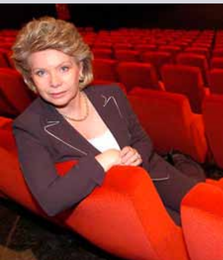
Viviane Reding Comisaria Europea de Sociedad de la Información y Medios de Comunicación