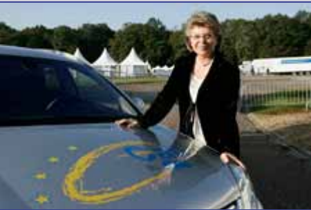
Viviane Reding Comisaria Europea de Sociedad de la Información y Medios de Comunicación

http://europa.eu/rapid/pressReleasesAction.do?reference=IP/09/1245&format=HTML&aged=0&language=ES&guiLanguage=fr