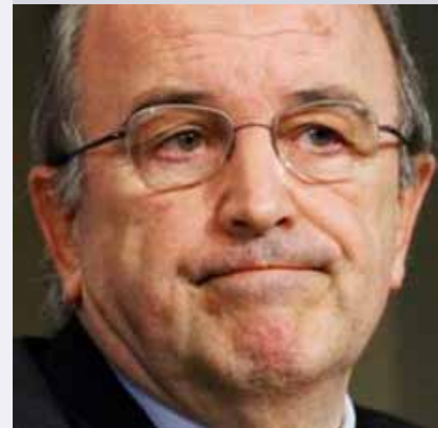
Joaquín Almunia Comisario Europeo de Asuntos Económicos y Monetarios

En palabras de Joaquín Almunia, Comisario europeo de Asuntos Económicos y Monetarios: «Abordar la sostenibilidad a largo plazo de nuestras finanzas públicas constituye uno de los principales factores impulsores de nuestra estrategia de salida de la recesión. Necesitamos seguir apoyando la recuperación, pero en un contexto de gran deterioro de la hacienda pública, las medidas encaminadas a aumentar la confianza y fomentar la demanda sólo podrán ser fructíferas si los mercados y la opinión pública las consideran temporales y compatibles con la sostenibilidad a largo plazo. Definiendo estrategias claras para el periodo posterior a la crisis reforzaremos la eficacia de las medidas de apoyo a corto plazo y crearemos las condiciones para un crecimiento económico sostenido y equilibrado en el futuro».