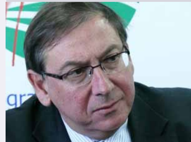
Jean Luc Demarty Director General de Agricultura y Desarrollo Rural de la Comisión

En su primera reunión celebrada en Bruselas el martes 13 de octubre de 2009, el Grupo de expertos de alto nivel sobre la leche mantuvo discusiones constructivas sobre las relaciones contractuales y la capacidad de negociación en el mercado de productos lácteos. Dicho Grupo fue creado por la Comisión Europea para examinar el futuro a medio y largo plazo del sector lácteo, particularmente teniendo en cuenta la eliminación progresiva de las cuotas lácteas, que serán suprimidas en abril de 2015. Sus trabajos avanzan en paralelo a las medidas que la Comisión está introduciendo para estabilizar a corto plazo el mercado de los productos lácteos. El Grupo está presidido por Jean-Luc Demarty, Director General de Agricultura y Desarrollo Rural de la Comisión, y los Estados miembros están representados por altos funcionarios. El Grupo tiene previsto celebrar otras reuniones con carácter mensual y elaborar su informe final a últimos de junio de 2010.