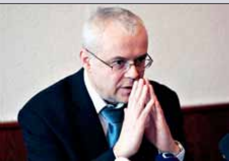
Vladimír Špidla Comisario de Asuntos Sociales

Con el triste telón de fondo de los prácticamente 80 millones de personas - un 16 % de la población de la UE - que viven por debajo del umbral de pobreza y se topan con graves obstáculos para acceder al empleo, la educación, la vivienda y los servicios sociales y financieros, la encuesta que se publica hoy arroja luz sobre las múltiples facetas de la pobreza y la exclusión social.