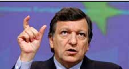
José Manuel Barroso Presidente de la Comisión Europea

El Presidente de la Comisión Europea, José Manuel Barroso, ha manifestado lo siguiente: «La Comisión se halla en el buen camino para alcanzar su objetivo en relación con la reducción de los trámites burocráticos que deben realizar las empresas. Estas deberían ya estar ahorrando 7.600 millones de euros al año. Si los Estados miembros y el Parlamento Europeo apoyan plenamente nuestras propuestas, esa cifra se incrementará hasta 40.000 millones de euros al año. La mejora de la reglamentación es un trabajo que no se acaba nunca. No solo hay que modificar las normas inadecuadas, sino también conseguir que las normas adecuadas funcionen mejor, gracias a las nuevas tecnologías y a la innovación. Seguir simplificando la reglamentación europea y las reglamentaciones nacionales - sin menoscabo de la protección de los ciudadanos - será un elemento fundamental para la próxima Comisión en sus esfuerzos para promover una recuperación económica sostenible».